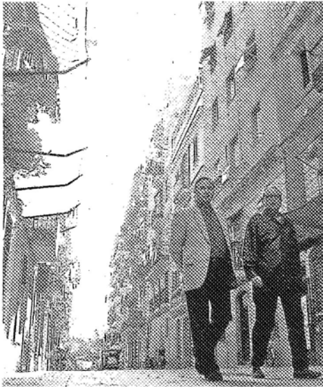
Las ayudas van dirigidas a edificios de más de 30 años.