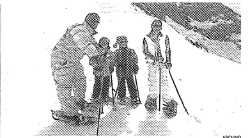
El calendario escolar cambia el curso que viene y habrá vacaciones en febrero.

15 ESTUDIOS EN MARCHA Desde septiembre, 47 comunidades han pedido información sobre las ayudas y de éstas, 15 han solicitado un estudio de viabilidad.