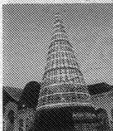
Uno de los abetos.

Como el Consistorio esgrimió que el coste se debía a que tenían una vida útil de 20 años y que estarían "amortizados" en cinco, este año vuelven a la ciudad, aun-